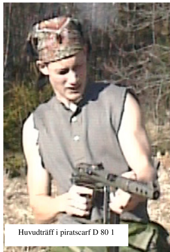
Huvudträff i piratscarf D 80 1

– MEDLEM I SVERIGES FYRVERKERIBRANSCH FÖRBUND