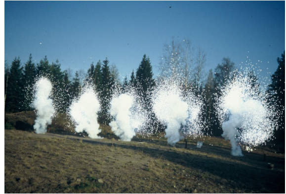
Fem styck seriekopplade art no 605